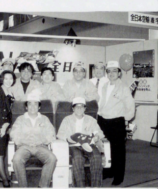
グローバルフェアから(スチュワーデスさんと青年部がジャンケンマンショーを演出)

横浜フリーゲルグスが健闘している。Jを制す若き精鋭の全力プレーに、喝采を贈るファンも多いことだろう。 全日空機は、高い定時出発率を誇るばかりでなく、国際航空旅客協会による93年「世界の安全な航空会社16社」のひとつに認定され