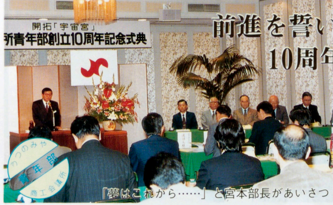
「夢はこれから……」と宮本部長があいさつ