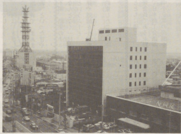
入居を待つ県産業会館