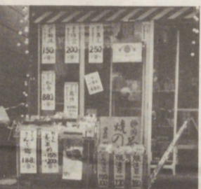
物産安定運動協力店(ユニオン通り)