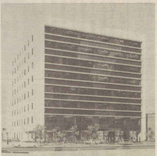
県産業会館完成予想図

融資枠を拡大 国の中小企業重点施策 新年度の予算案からみた中小企業関係の諸施策の一部は、すでに本誌前号でのべたとおりですが、更に次のような施策も講じられようとしています。 ①中小企業相談委員の新設 第1次を委員に委嘱、中小企業者からの経営相談に当たる。 ②間接近代化事業の創設 中小企業高度化事業の需要の多様化に対応するため、他に設備 リース事業の対象に、安全衛生施設の追加等を行う。 ③組合人材養成事業の創設 組合活動の強化をはかるため、中小企業の組織化対策の抜本的強化を図る。 ④設備近代化資金等の拡充 設備貸付資金と共に、貸付等の対象業種を拡大(サリシス業のうち旅館業を追加)すると共に、下請取引締結の円滑化のため、経営対象企業への貸付等を強化する。