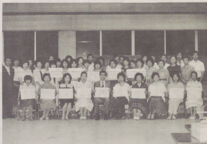
←54年度 初級簿記講座 (4~7月)