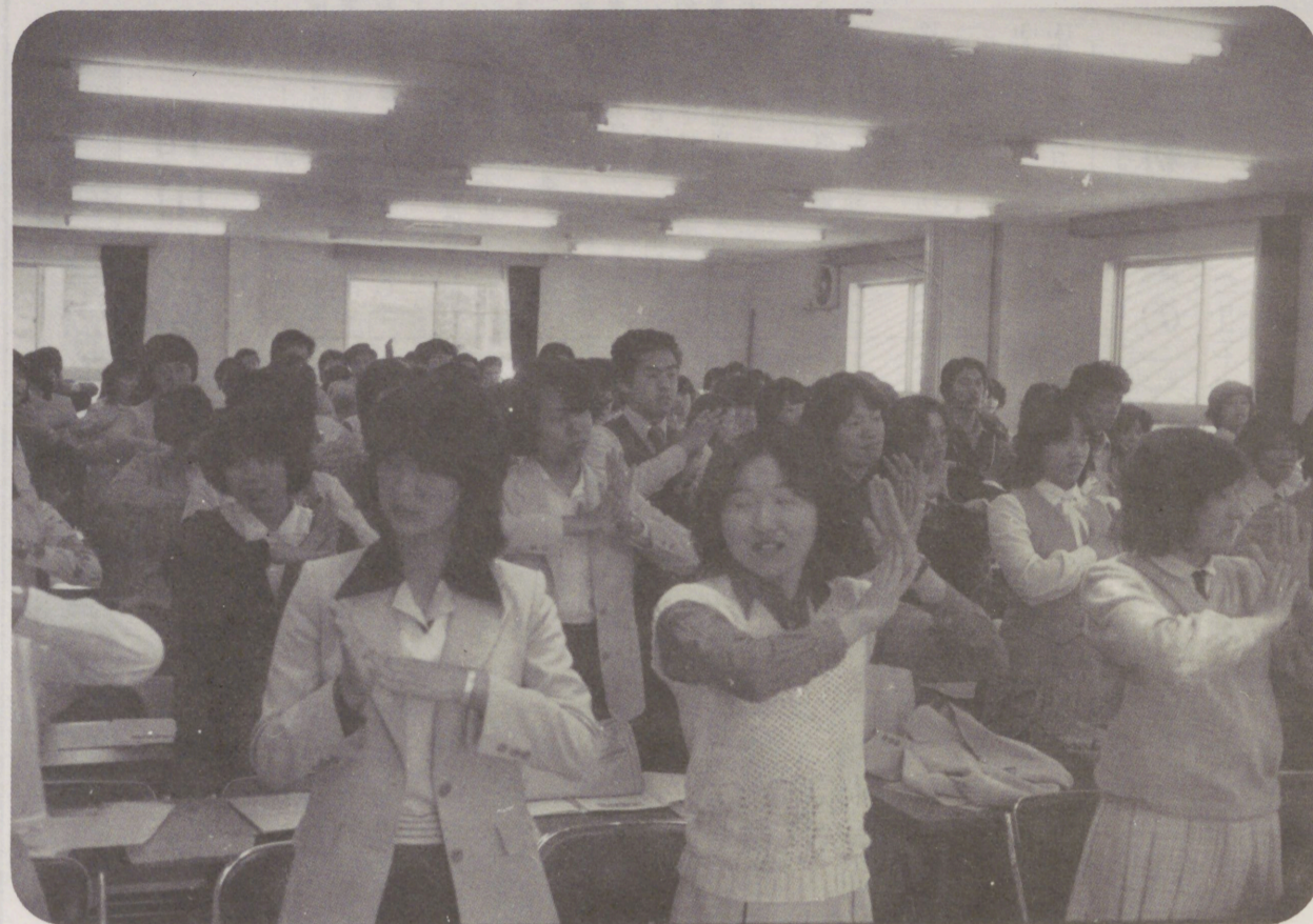
↑54年度 新入社員講習会 青少年ホームで (4月)