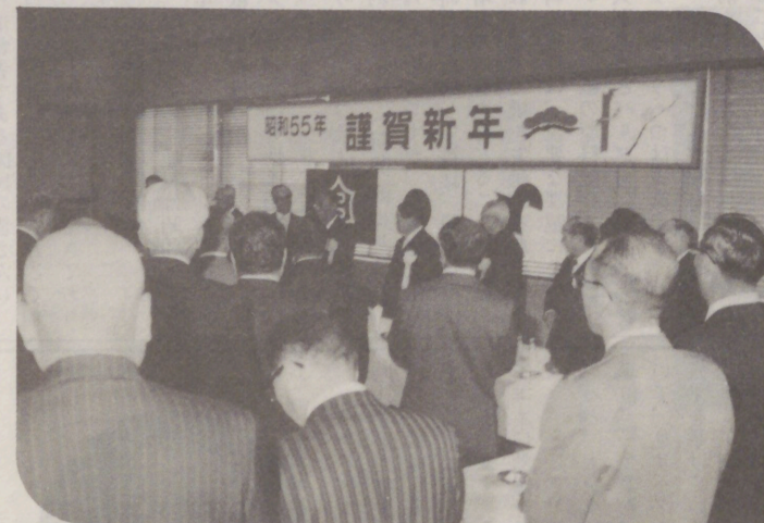
55年・新年名刺交換会 (1月)