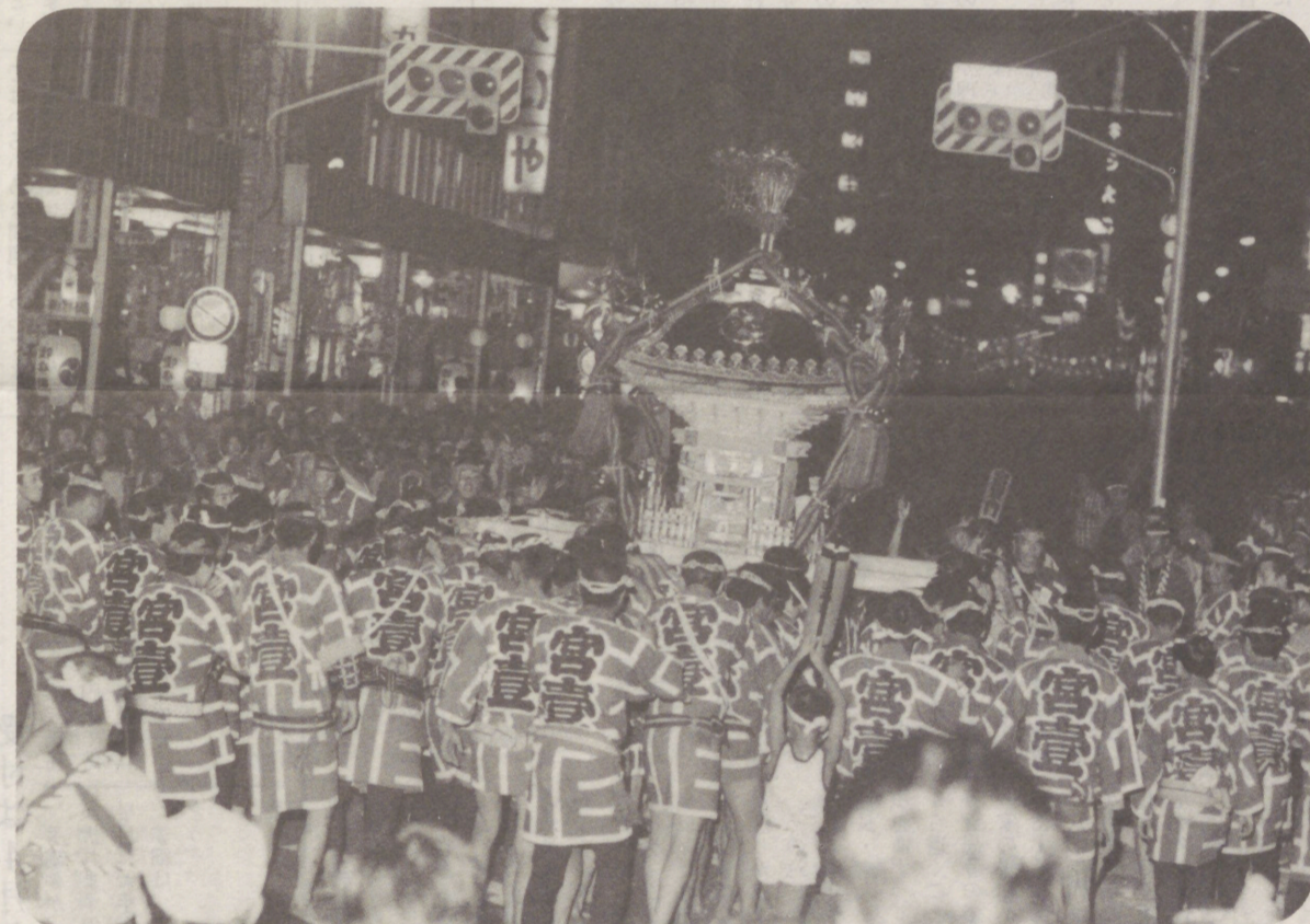
第4回ふるさと宮まつり (8月)