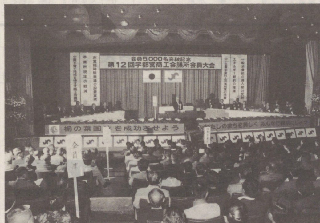
↓ 会員5,000人突破記念 第12回会員大会 (10月)