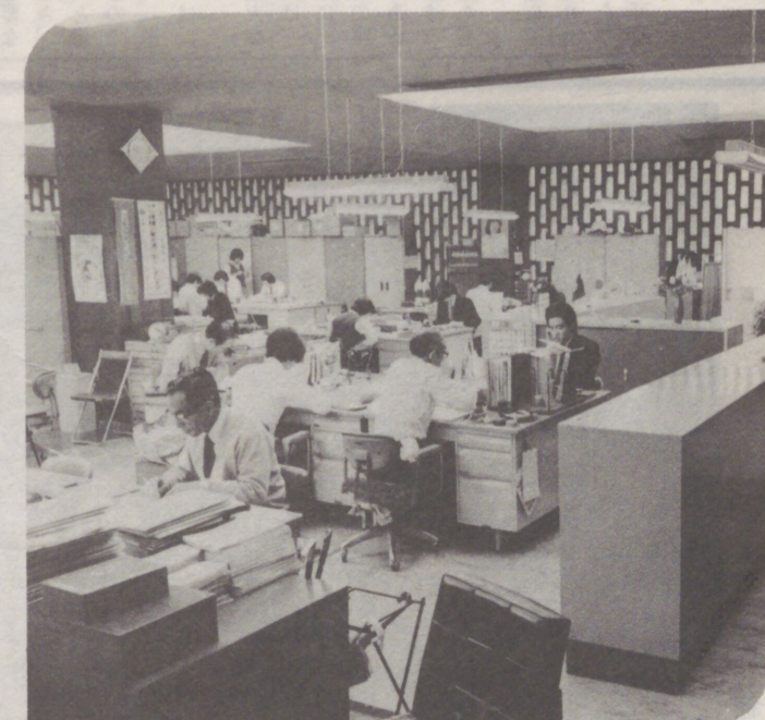
仮事務所 (県商工会館) で執務 (4月)