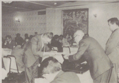
54年度 振興委員委嘱式 (4月)