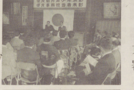
勤労青少年ら40人表彰 東署と地区職警連

東警察署と地区職警連は、勤労青少年の功績を表彰し、社会貢献を奨励した。表彰された40人は、地域の発展に大きく貢献している。