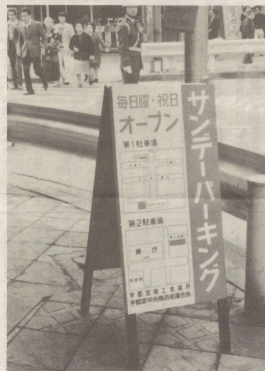
↑サンデーパーキング・オープン 市内2カ所 (4月)