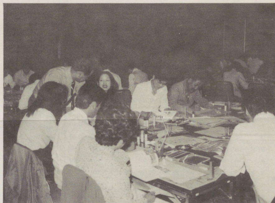
↑POP広告講習会 くらかみ荘 (10月)