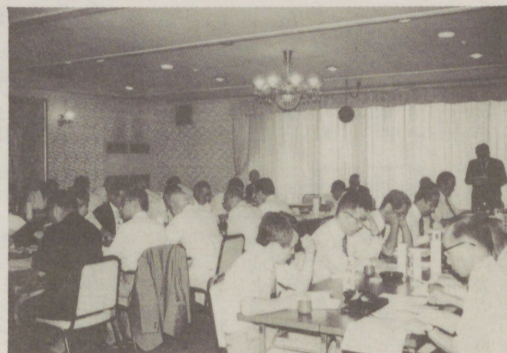
常議員会並びに通常総会 (7月)