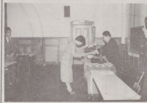
55人に修了証書 初級簿記講座

市教委と当会議所の共催で、八月から十一月まで毎週二回、計三十一回にわたって開かれた初級簿記講座が、十一月十四日午後六時半から閉講式を行った。