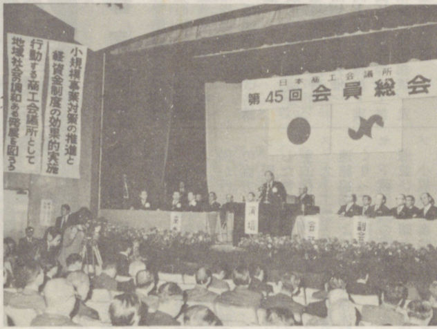
小樽商工会連合会主催の「日商第45回会員大会」が、小樽市中央本町で開かれ、日商の役員と各会員の代表者らが出席した。

わが国経済は、昭和四十八年秋の石油ショック以来インフレの不況が長期化し、かつて経験したことのない経済危機に直面している。昭和五十二年は「経済の年」としてこれを捉え、インフレなき景気回復を軸とした経済運営を重点を置く方針と聞くが、物価問題、雇用問題等は今後予断を許さない困難な情勢にあり、政策の動向如何によっては、商工業をめぐり、景気回復の足取りは重く五十年秋から企業倒産は高水準に推移した。五十一年に入り輸出の好調に支えられて漸く不況から脱出の萌芽が見え始めたが五十一年秋以降、EC等欧米諸国の日本品輸入規制問題の発生により、輸出の先行き勢化は避けられず、一方、政局の混迷から経済政策の運営も円滑を欠いたこと等から景気はゆるやかな回復基調にあるといえるもの、いわゆる「中だるみ」状態にある。また企業収益回復の遅れや企業間、業種間に格差拡大が見られ、最近では長期不況による