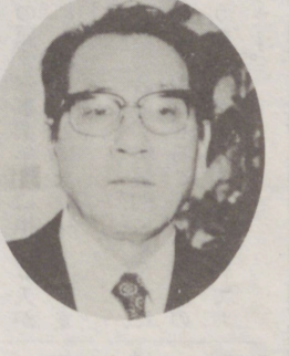
日本ハム球団 社長 三原 脩

ゲームは、競争だから戦争と同じことである。昔「兵は巧謀より拙速を尚ぶ」ということがよく言われた。つまり、あれこれと迷うよりも早く行動した方がよい。