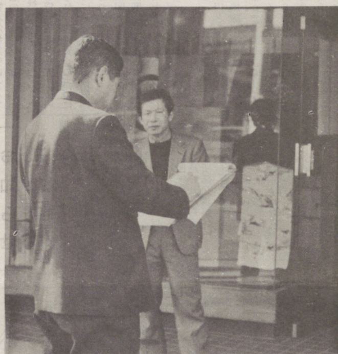
← 個別店舗診断指導 陽南地区で(二月)