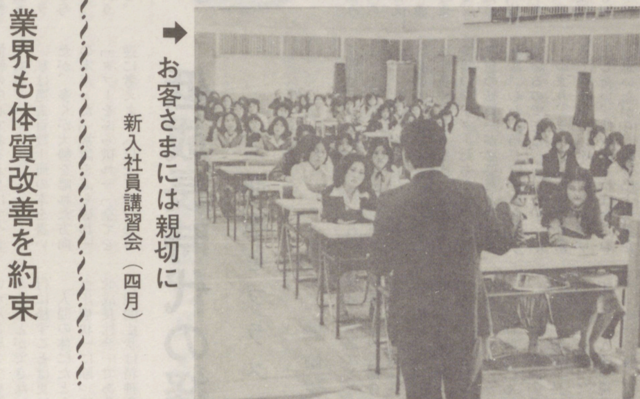
→ お客さまには親切に 新入社員講習会(四月)