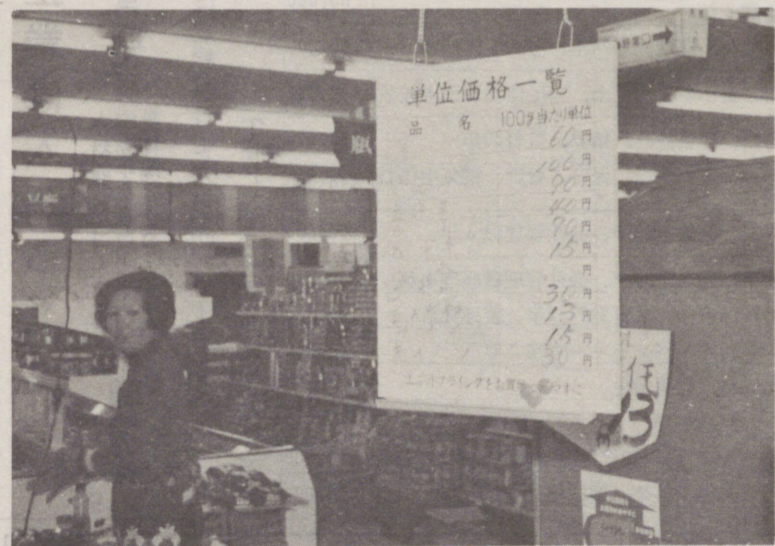
← 単位価格表示制度 モデル四店で 実施(十月)