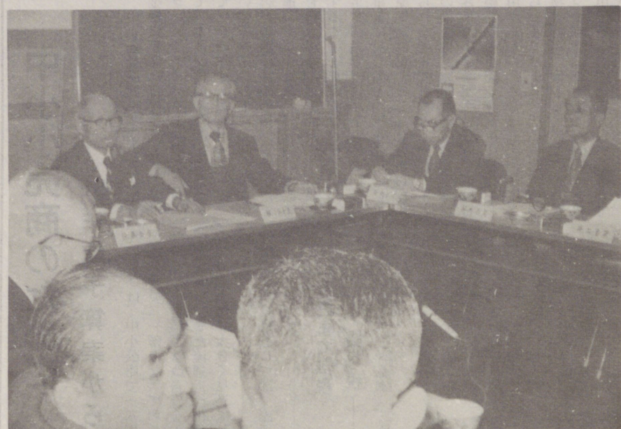
↑ 小売店保護と消費者利益のために 大型店対策と取組む商調協