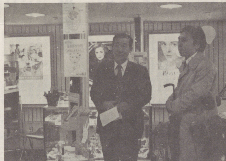
↑ POPで販売促進 講習会と臨店指導(十月)