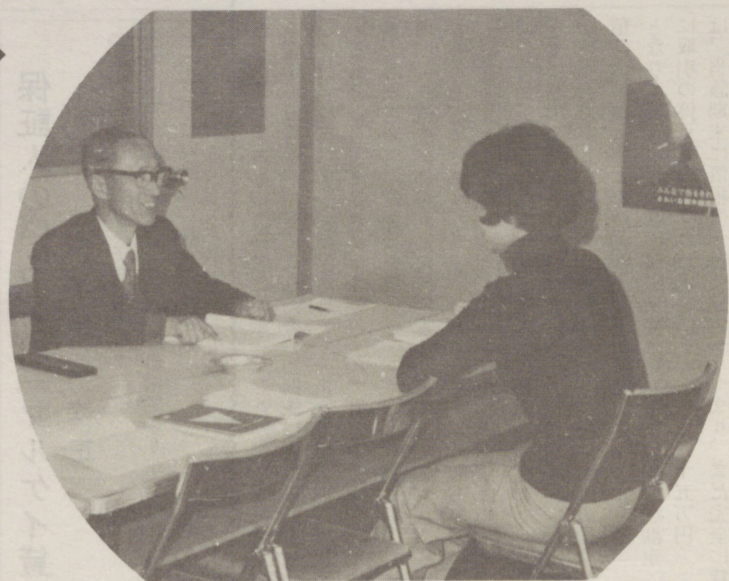
→ お気軽にご利用を 顧問税理士による税務指導(毎月)