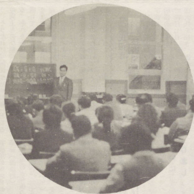
← 青年学級簿記講座(四~七月)