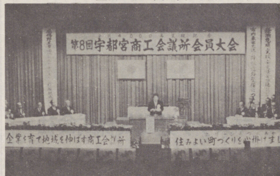
第8回宇都宮商工会議所会員大会