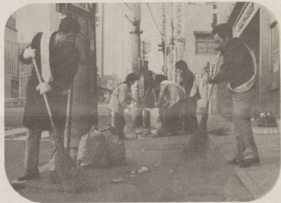
↑ きれいな宇都宮運動 大通りの清掃奉仕