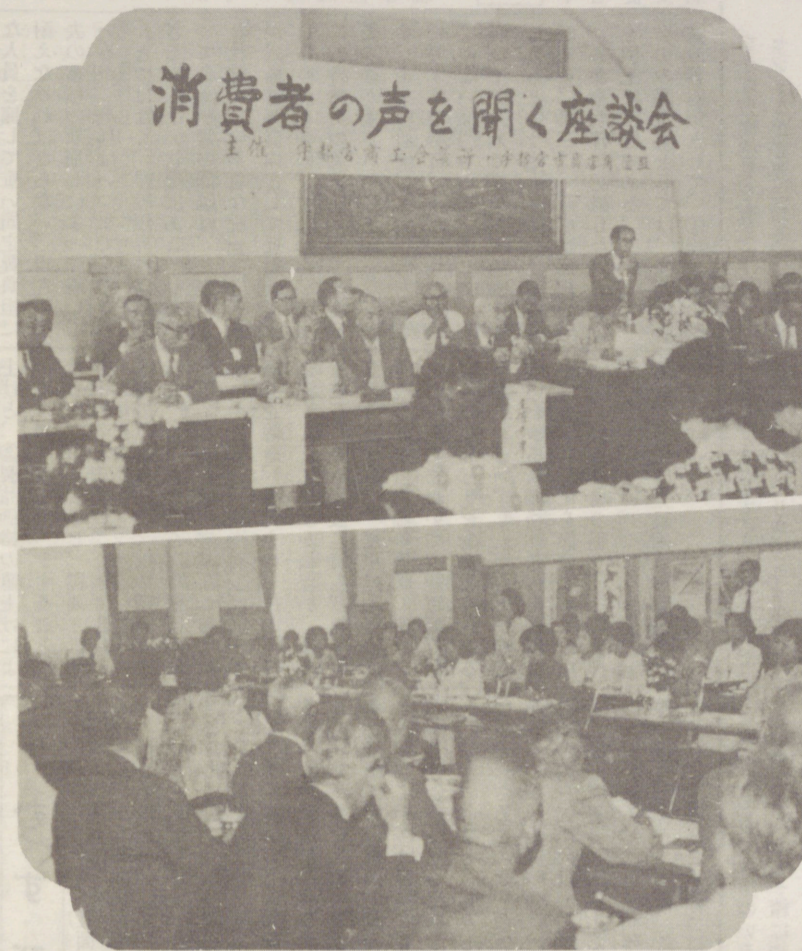
消費者の声を聞く座談会