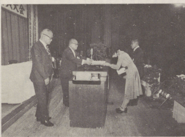
← 八九四人を表彰 優良従業員(十月)