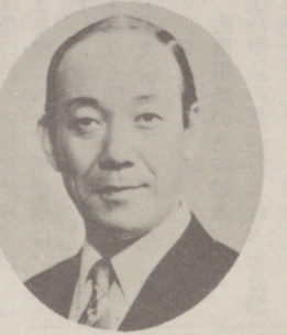
厳しくなる 労働環境