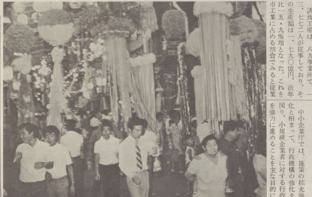
主婦のパートと税金

女性の勤労意欲の高まりを反映して、主婦がパートで働くことが多くなっています。そこで、主婦がパートで働いたときの配当金と所得税について説明します。 一、所得税は、一年間の所得金額から配偶者控除、扶養控除および基礎控除などの所得控除を差し引いた残額に税率がかかるしくみになっています。 二、配偶者控除は配偶者に一定額以上の所得があるときは、夫の所得から差し引くことができます。配偶者控除が受けられる所得の限度は、主婦がパートなどの所得