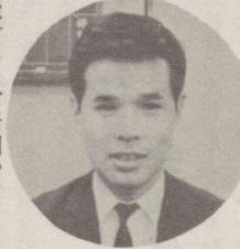
写真: 折込みの重要性を説く著者