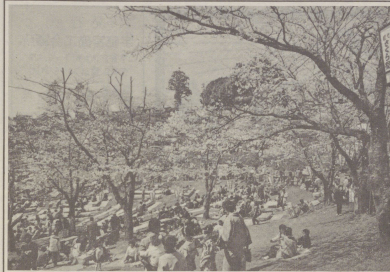
近づくさくら祭り

① 中小小売商業者は、経営近代化に当たり企業規模の著細性による経営知識、経営技術等の蓄積の不足その他の不利を認識し、これを是正するため積極的に協同意見を持ち、事業共同組合、商店街振興組合その他の組合又は経営近代化のための機構を設立し、又はこれに加盟して企業経営のシステム化を図り、わが国流通機構のシステム化に寄与するよう努力するものとする。 ② 中小小売商業者は、組織化の推進に当たり、適切なリーダーを選任し、指導及び責任体制を確立するとともに、積極的な組織の意思決定に参加しその活動に協力するものとする。 ③ 共同事業の実施は、経営近代化のための共同の情報の収集と管理、商品や経営技術等の開発、従業員に対する教育、研修等を推進するほか、規模の利益の生ずる分野において仕入、販売、労務促進、配送、金融、事務、販売その他の業務の集約化を図るとともに必要に応じて物的共同施設を設置し、顧客吸引力の増大、コストの低減化を図るよう努力するものとする。 ④ 共同事業の実施にあたっては、組合員等の大部分がこれに参加できるとし、特に物的共同施設等の設置については、組合員等の大部分がこの施設が公平かつ有効に利用されるようその設置及び維持管理に要する費用の負担が過重とならないよう配慮するものとする。 ⑤ 共同事業の実施に当たっては、定期的なその効果を測定し、事業の再検討を実施するものとする。