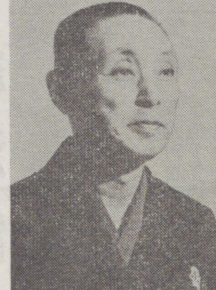
落語家 三遊亭円生

出願公開と先使用権 特許法の改正で、出願公開というものがあつた。出願公開とは、特許出願の日から一年以内に、その発明の内容が公衆に知られることである。出願公開により、出願人以外の第三者が、特許を受ける権利を主張する機会を得る。先使用権とは、特許出願の日以前、特許権者の許可なく、特許権の発明に係る発明を実施した者が、特許権者が特許権を行使するに当たっては、先使用権を主張して特許権者の実施を妨げない権利である。出願公開は、先使用権の主張を可能にするものである。