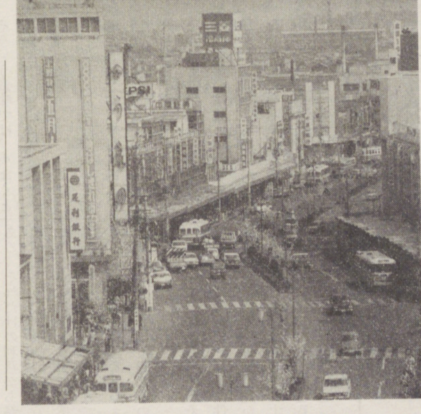
写真は第二次診断を受けた中心繁華街