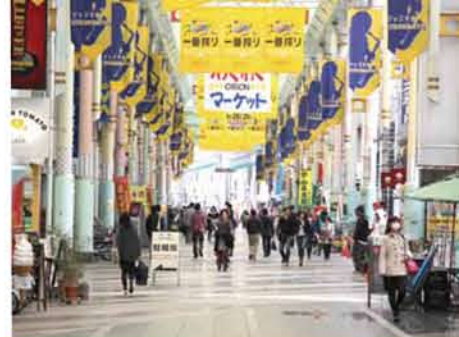
調査地点9 曲師町東