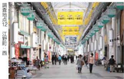
調査地点12 江野町西