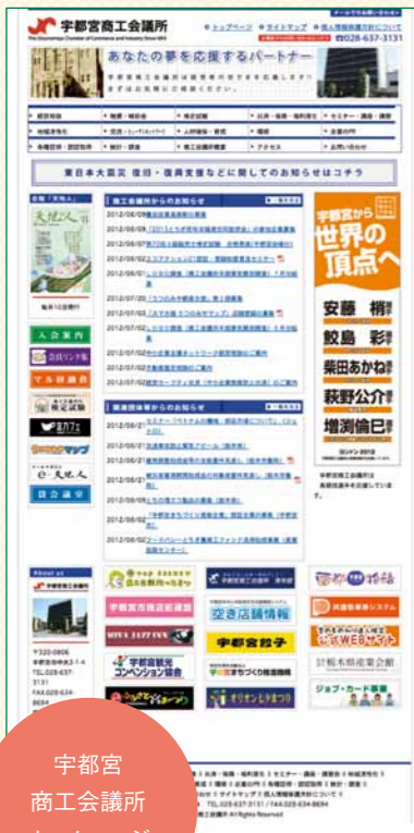
宇都宮 商工会議所 ホームページ