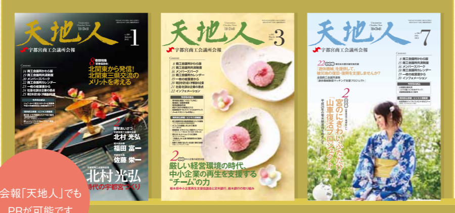
会報「天地人」でも PRが可能です

会報「天地人」内に、会員企業の紹介をする「会員情報局」コーナーがあります。こちらは掲載無料ですので、ぜひお申し込みください。