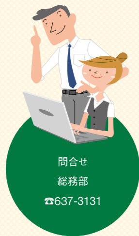
問合せ 総務部 ☎637-3131