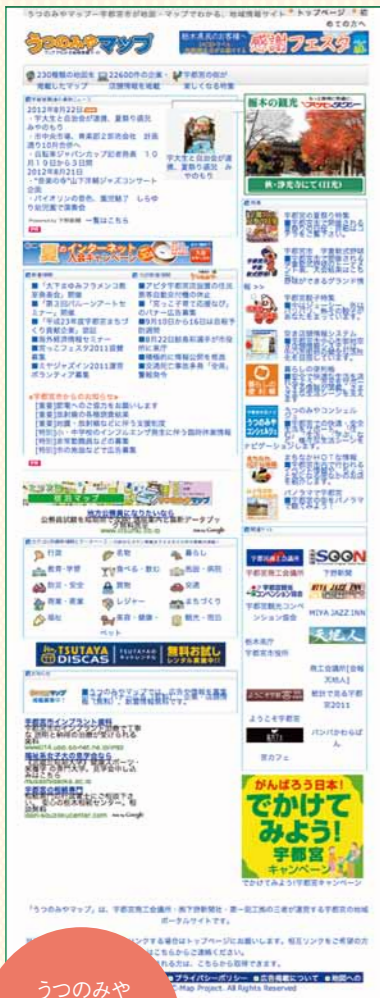
うつのみや マップ ホームページ