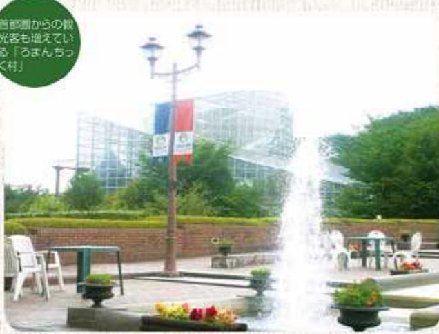
首都圏からの観光客も増えている「ろまんちっく村」

A. 「食」との関わりでいえば、農のテーマパークでもある「ろまんちっく村」ですね。見て、体験して、味わえるということで、県外からの方にも人気が高い施設です。温泉施設もあるので、のんびり骨休めもできます。それから契約農家から毎日朝採りされる新鮮野菜、果物の販売も、大人気です。