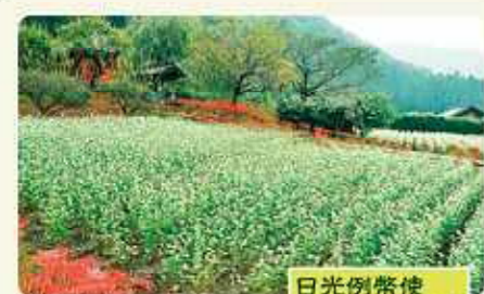
日光例幣使 そば街道

7. 日光市・鹿沼市・栃木市 日光例幣使そば街道 世界遺産に登録された日光の社寺、日光杉並木、日光国立公園の自然や温泉があります。地元産のそば粉を利用した農村レストランやそば店が、数多くあるのも魅力。 日光例幣使そば街道推進協議会 Tel.0289-62-5236