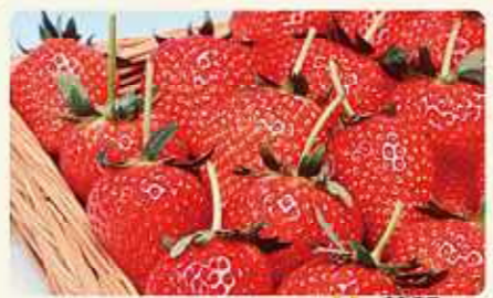
芳賀いちご夢街道

2. 大田原市・那須町 那珂川あゆ街道 アユの漁獲量日本一の那珂川。良質な水で生産される特色ある農産物。地元食材を使用したレストランや観光やの獲れたてのアユの塩焼きは格別です。 那珂川あゆ街道推進協議会 Tel.0287-23-8292