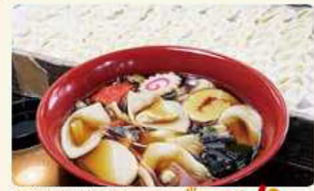
足利佐野めんめん街道

5. 矢板市・さくら市・塩谷町・高根沢町 たかはら山麓水街道 日本名水百選に選ばれた「高根沢湧水」。全国に誇れるおいしい「水」で作られたコシヒカリや豆腐や地酒などが魅力。水源となる高原山の美しい景観もおおすすめです。 塩谷地域食の街道推進協議会 Tel.0287-43-1252