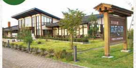
癒しスポット「梵天の里」

●問合せ 宇都宮「食の街道」推進協議会 (宇都宮市農業振興課内) Tel. 028-632-2843