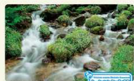
たかはら山麓 水街道

7. 日光市・鹿沼市・栃木市 日光例幣使そば街道 世界遺産に登録された日光の社寺、日光杉並木、日光国立公園の自然や温泉があります。地元産のそば粉を利用した農村レストランやそば店が、数多くあるのも魅力。 日光例幣使そば街道推進協議会 Tel.0289-62-5236