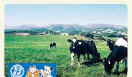
那須高原ミルク街道

とちぎ「食」の回廊 検索 検索サイト「とちぎ「食」の回廊」を入力してください。 とちぎ「食」の回廊情報ホームページ http://www.agrinet.pref.tochigi.lg.jp/tochigi_event/event.cgi