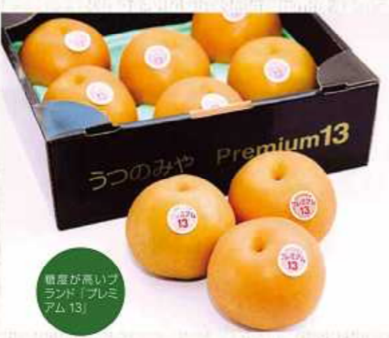
糖度が高いブランド「プレミアム13」

ら11月の「にっこり」まで、5カ月にわたって収穫されます。そんな宇都宮のナシの「幸水」「豊水」の中から、特に形がよく糖度の高いものを「プレミアム13」というブランドとして認定しています。通常、ナシの糖度は11~12ですが、このブランドは13以上ですから、かなり甘さが際立って、大変人気が高いブランドです。