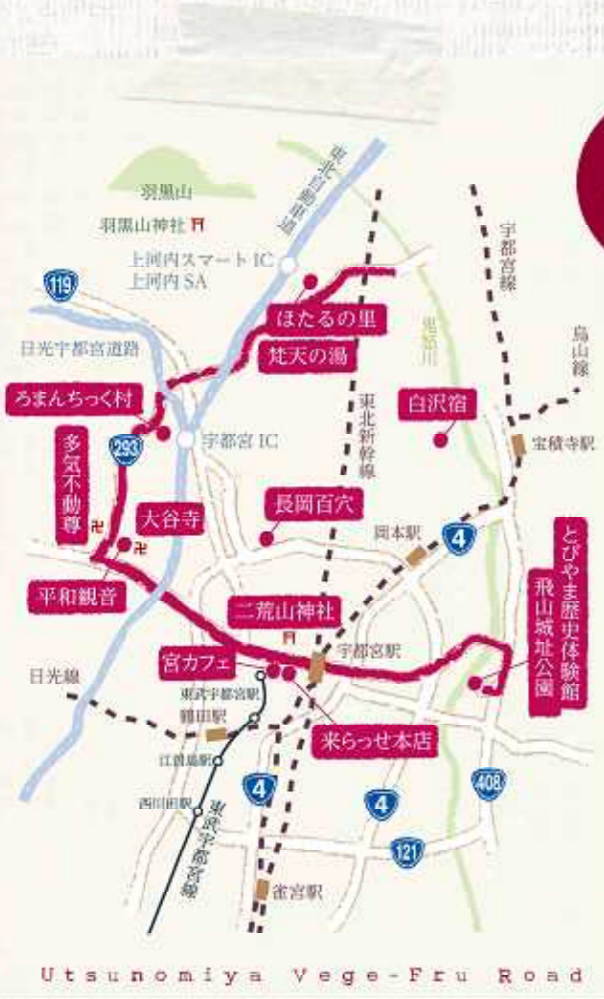
Utsunomiya Vege-Fru Road

もちろん大谷寺や平和観音、多気不動尊、飛山城址公園といった歴史スポット、宮カフェやポット、宮カフェや来らせなどの食スポットも、外せませんね。とにかく、ぜひ皆さんで誘い合っ、お出かけください。