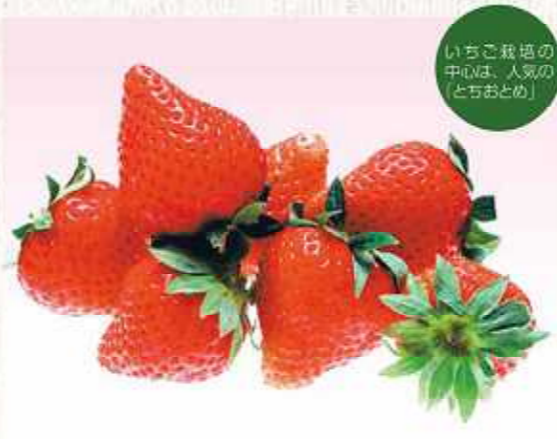
いちご栽培の中心は、人気の「とちおとめ」