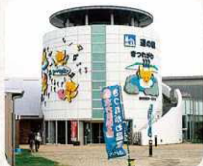
道の駅さくらし(さくら市)