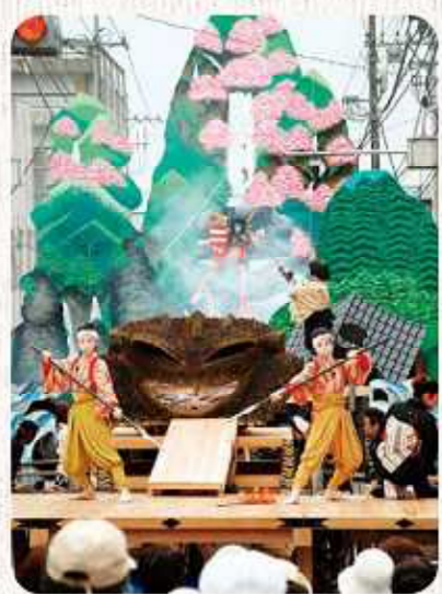
山あげ祭(那須烏山市)

最後に、現在行なっているイベントなどを紹介します。現在「八溝そば街道」「日光例幣使そば街道」「足利佐野めんめん街道」の3街道で、そばのスタンプラリーを行なっています(6月30日(土)まで)。集めたスタンプの数でさまざまな特典やプレゼントがもらえるというものです。また全街道で「とちぎのジェラートスタンプラリー」を行なっています(8月末日まで)。栃木が「生乳生産量本州1位」