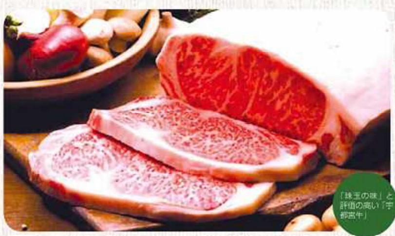
「珠玉の味」と評価の高い「宇都宮牛」

A. 餃子との関連で、ニラはずいぶん周知されたと思います。意外なものにアスパラガスがあります。J-Aうつのみやが「アスパラリン」の名前でブランド化しており、次第に注目度が上がっています。太くて品質の良いものが多いので、首都圏では高級食材として歓迎されています。また宇都宮牛ブランドも、銘柄牛としての歴史も古く、ファンが多い「食」です。