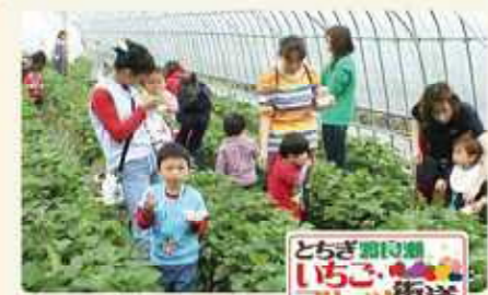
とちぎ渡良瀬いちご フルーツ街道

6. 壬生町・上三川町・下野市・小山市 歴史とロマンのかんぴょう街道 全国一のかんぴょうの産地。かんぴょう料理や史跡、結城紬の体験、直売所の新鮮野菜など、魅力あふれる街道です。今年のかんぴょうが伝わって300年記念の年なので、さまざまなイベントも楽しめます。 歴史とロマンのかんぴょう街道推進協議会 Tel.0282-23-3425