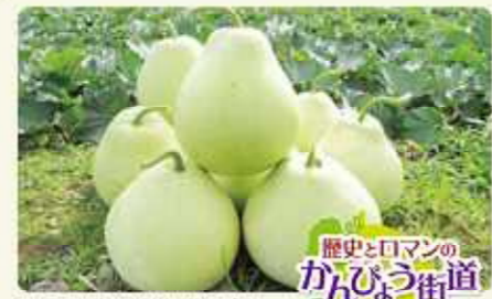
歴史とロマンの かんぴょう街道

8. 足利市・佐野市・栃木市 足利佐野めんめん街道 日本最古の学校「足利学校」などを有する県南の観光地。仙波や出流(いずる)そば・うどん・ポテト入り焼きそば、それに佐野ラーメンといった多彩な麺が魅力です。 足利佐野めんめん街道推進協議会 Tel.0283-23-1455