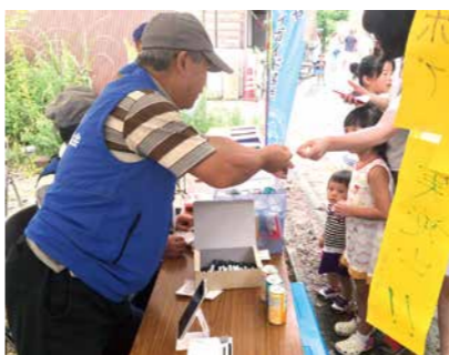
「大谷夢あかり」イベント会場で試験を兼ねて導入

「コンピュータシステムの役割は『これまで人間が手間暇かけて行っていた業務を、コンピュータが代行することで、効率化・省力化を図る』ということ。それによつて生み出されるのが『自由な時間』です。自由な時間を、新