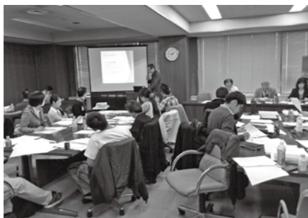
過去の創業スクールの様子

令和元年10月24日（木）〜12月10日（火）【全8回】 いずれも18時30分〜21時30分