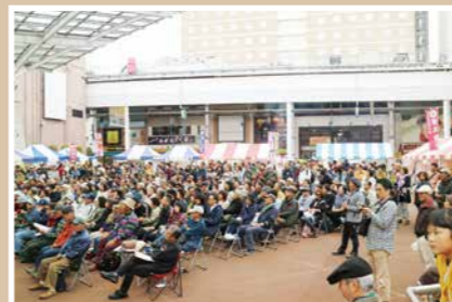
客席はいつも超満員!

EVENT 02. ミヤ・ジャズイン2019 2019.11.2~3 11:00~19:00