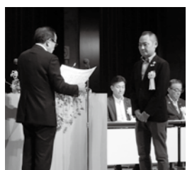
役員・議員法人表彰を受ける(株)アオシヨー様

【提言・要望事項】 「活力ある企業づくりの推進」 「経営力強化と新たな成長への挑戦」 ① 中小企業・小規模企業対策 ② 産業振興策 「魅力ある地域づくりの推進」 「誇れる故郷」とちぎの創造 ① 観光振興策