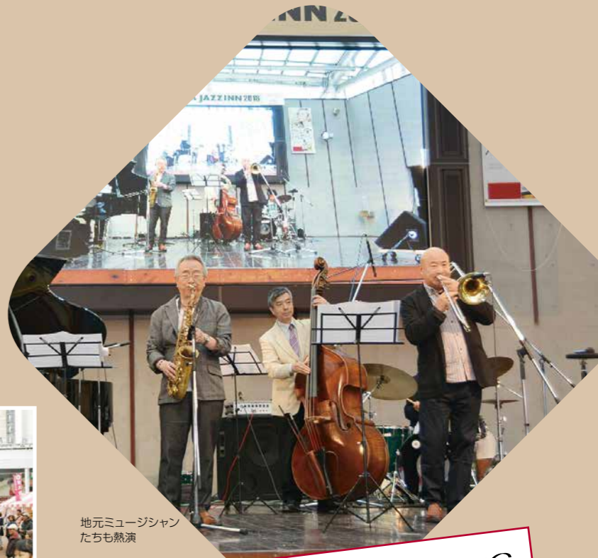
地元ミュージシャンたちも熱演

晴れの日も多く、お出かけしやすい気候の11月。当日は他にもさまざまなイベントが開催されますので、ぜひお越しください!