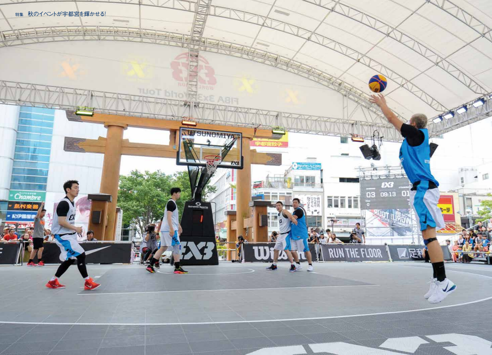
3x3の試合は屋外の広場での開催が基本