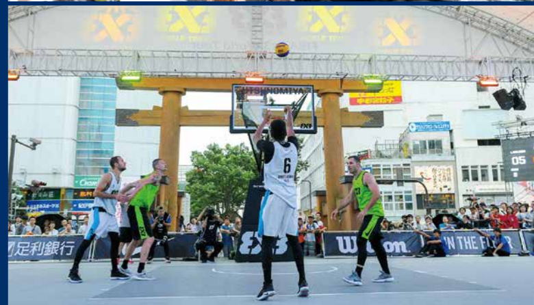
写真上/ファンの数も年々増え、中心市街地のスポーツイベントとしても定着 写真下/伝統を伝える宇都宮二荒山神社の鳥居と、新しいスポーツ3x3が溶け合い、都市の魅力に

Q トッププレイヤーの激戦を見る ことが出来るのですか。チケット はどこで買えるのですか?