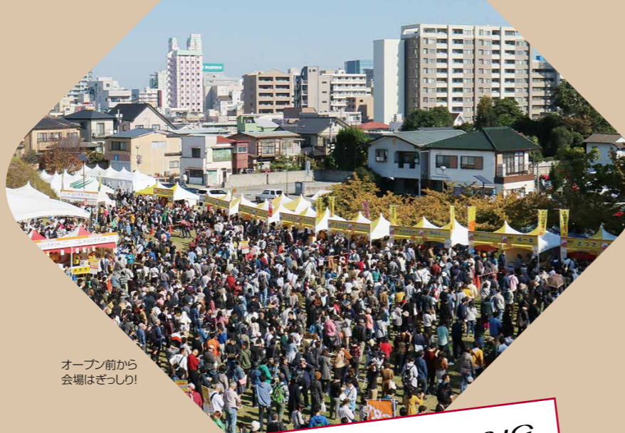
オープン前から会場はぎっしり!

EVENT 03. 宇都宮餃子祭り2019 2019.11.2~3 10:00~16:00