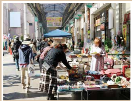
オリオン通りにもたくさんの店が

EVENT 04. 宮の市(商業祭) ストリートフェスティバル 2019.11.2~3 11:00~16:00