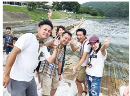
やな場で交流を深める参加メンバー

8月交流事業を8月24日(土)、「大交流・暑気払い大会 in 大瀬」と銘打ち、大瀬観光やな(茂木町)で開催しました。 今年度の交流委員会は、「二期一会」今、YEG 全ての機会を全力で〜の2019年度年スローガンのもと、青年部内の相互交流が図られるよう活動を行っています。 会員の多くが年度初めから一息つくタイミングということもあり、たくさんの方の社業の現状のことや今後の展望などについて活発な意見交換が行われました。その後、テーブルに運ばれてきた取れたての鮎を始めとする旬の食材の数々。それらに舌鼓を