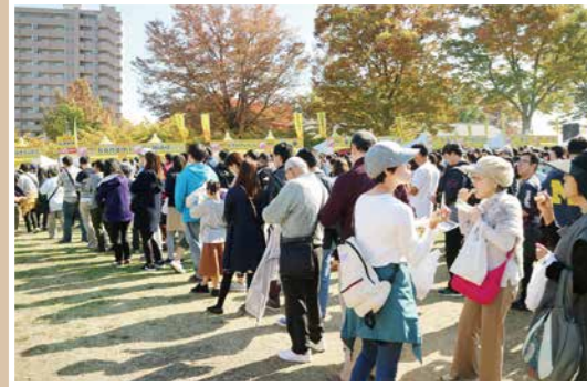
ブースはいずれも長蛇の列