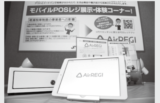
事務所にPOSレジ「AirREGI」(リクルートライフスタイル社)を展示しています

当所では日本商工会議所と連携し、代表的なPOSレジであるAirレジ(リクルートライフスタイル社)を展示しています。当所経営指導員が、使い方をわかりやすくご説明しますので、実際に手に取り、POSレジを体験してみてください。