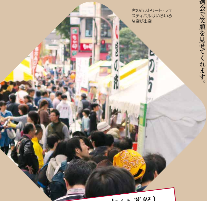
宮の市ストリート・フェスティバルはいろいろな店が出店

EVENT 04. 宮の市(商業祭) ストリートフェスティバル 2019.11.2~3 11:00~16:00