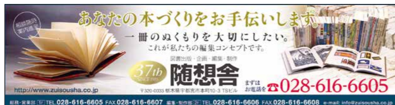
天地人 No.701 2022年2月号掲載