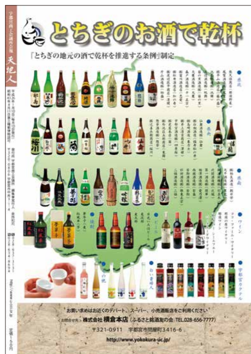
天地人 No.604 2014年1月号掲載