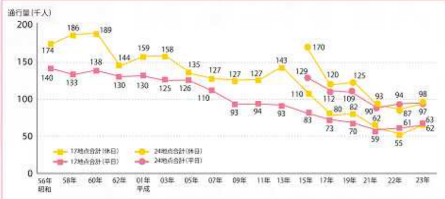
図2 調査地点別通行量