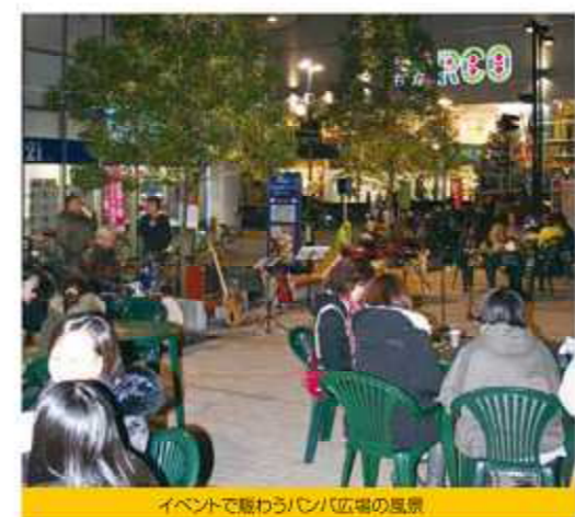
イベントで賑わうパルコ広場の風景

● 居住地 ● 市内、市外、県外からの来街者の割合は63%・27%・10%となる。 ● 県内来街の上位3位は、鹿沼市12%、日光市12%、下都賀郡10%だった。