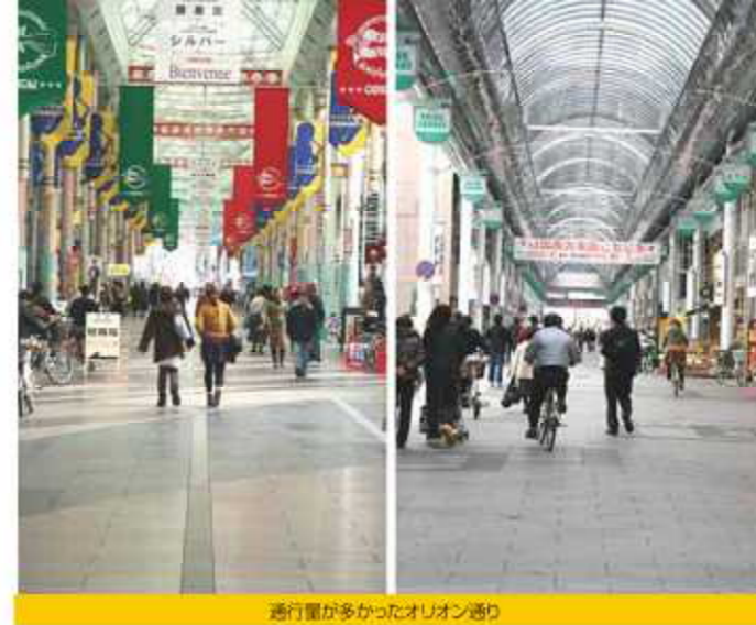
通行量が多かったオリオン通り