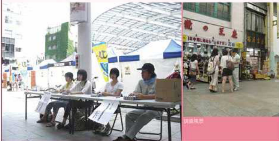
昨年行われた説明会の様子