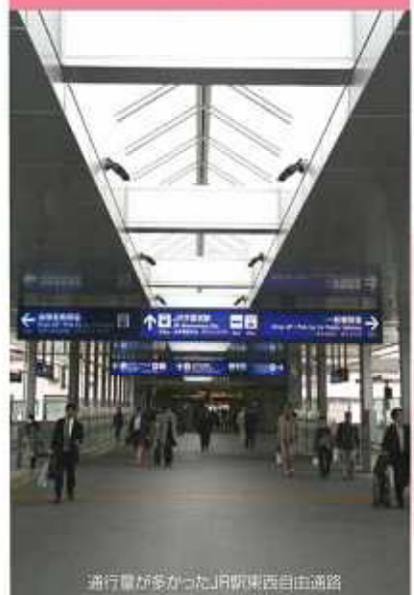
通行量が多かったJR宇都宮自由通路 当所と宇都宮市で定期的に実施している、中心商店街を対象とした「商店街通行量・来街者実態調査」が、今年も7月・8月に実施されました。今回は調査結果の概要をご報告するとともに、調査結果から読み取れる現状を分析します。

平成23年度の「商店街通行量・来街者実態調査」は、大通りやオリオン通り、ユニオン通り、J R宇都宮駅周辺など、中心商店街をほぼ網羅する範囲で行っている調査です。今回は、次のような要領で実施しました。