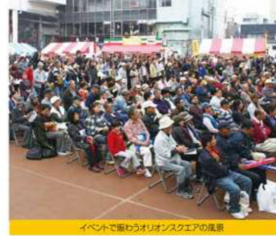
イベントで賑わうオリオンスクエアの風景

【調査年月日】 平成23年7月31日(日)・8月1日(月) 午前10時～午後7時 【調査地点】 (1) J R駅西口ペDESTリアンデッキ (2) FES前(ユニオン通り) (3) バルコ宇都宮店前 (4) 長瀬文具店前(オリオン通り) (5) 近畿日本ツリスト前(大通り) (6) オリオンスクエア前(オリオン通り) (7) サイトウシャツ店前(東武馬車道通り) 【調査方法】聞き取り 【調査対象者】1,447人 (男性571人、女性876人) では、今回の調査について、報告書から