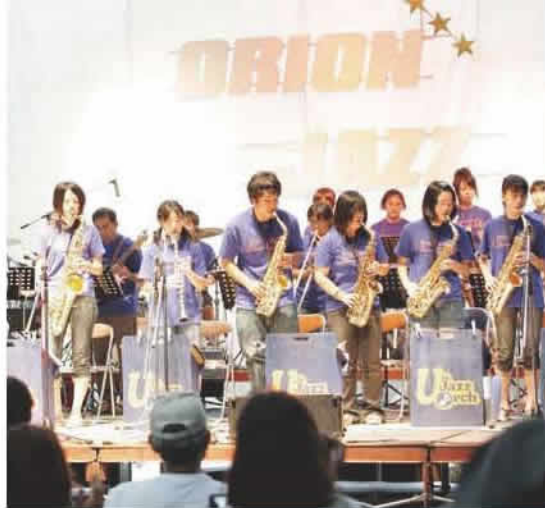
【写真上】 恒例の「オリオンジャズ」