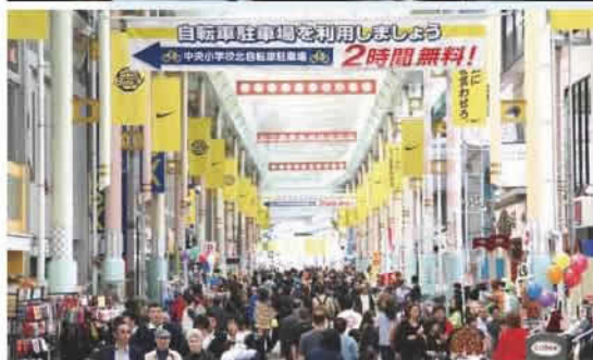
【写真下】 「宮の市」で賑わう オリオン通り